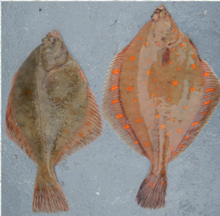
Gerne verwechselt: Flunder (links) und Scholle.

Die Flunder ist ein Plattfisch, der an das Leben auf dem Boden von Gewässern angepasst ist. Der Körper ist seitlich abgeflacht und asymmetrisch aufgebaut, da beide Augen auf der gleichen Körperseite liegen. Die Durchschnittsgröße der Flunder liegt bei 20-30 cm, bei einem mittleren Gewicht von 300 g. In Ausnahmefällen können sie bis zu 60 cm groß und bis zu 3 kg schwer werden. Die Bauchseite ist fast weiß, die Oberseite kann dem Untergrund angepasst werden und hat grünliche bis rotbraune Töne, teilweise mit rötlichen Flecken. Entlang der Seitenlinie liegen deutlich spürbare Knochenhöcker. Rücken- und Afterflosse bilden vom Schwanzstil ausgehend einen seitlichen Flossensaum. Die Rückenflosse reicht vom Auge bis zum Schwanzstiel, die Afterflosse von Höhe